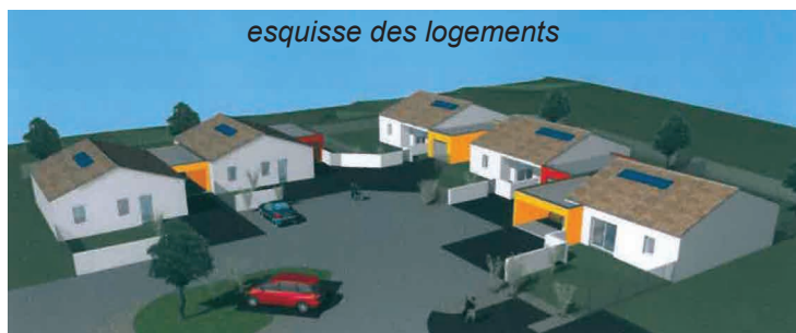
esquisse des logements

Les personnes intéressées doivent retirer un dossier en Mairie. Selon le calendrier des différentes phases de travaux, les futurs propriétaires pourront choisir le coloris des matériaux (carrelage, peinture, etc.). Des compléments d'informations peuvent être obtenus en contactant Céline TELLIER (Vendée Habitat) au 02.51.09.85.57.