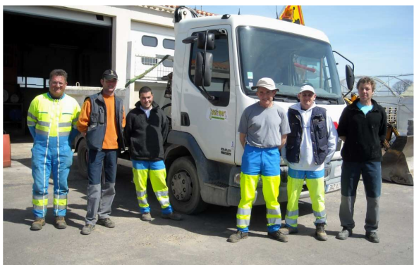
Les 6 volontaires qui ont participé au déblaiement

Répondant à la demande de main d'œuvre des maires de L'Aiguillon et de La Faute, la municipalité jardaise a décidé d'apporter son aide pour le déblaiement et l'évacuation des gravats occasionnés lors de la tempête.