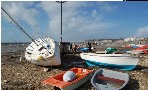
Les plus gros dégâts matériels ont surtout touché le port

Des devis visant à chiffrer le montant global des travaux sont demandés.