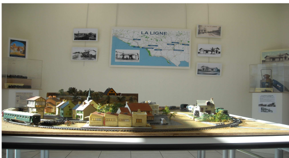
« De Talmont à Luçon par le train » à l'Espace Culturel jusqu'au 31 mai

C'est plus d'une trentaine d'écrivains qui se retrouveront pour présenter et dédicacer leurs œuvres. Pour clore cette journée, un concert animé par