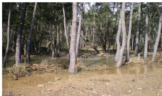
L'aire de pique-nique de Ragounite inondée