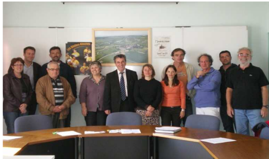
Rencontre des représentants des ostréiculteurs et des élus jardais

venir en aide aux ostréiculteurs du Payré, dont les matériels ont été dégradés et le montant des dégâts estimé à environ 400.000 €. Ce concert sera non payant, la générosité de chacun sera sollicitée par des urnes qui seront mises à la disposition des spectateurs et une quête de solidarité aura lieu pendant le spectacle. Les fonds récoltés seront intégralement reversés à l'association SCOBAP, qui regroupe 18 ostréiculteurs du Payré dont 3 sont jardais.