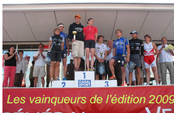
Les vainqueurs de l'édition 2009

Dimanche 13 juin, l'Office Municipal des Sports et Loisirs (OMSL) organise son 24e Triathlon sur le Port de Plaisance de Jard-sur-Mer.