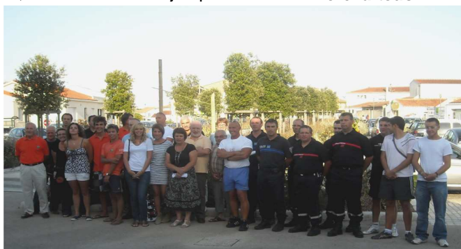
Les saisonniers reçus à la mairie après un été bien rempli