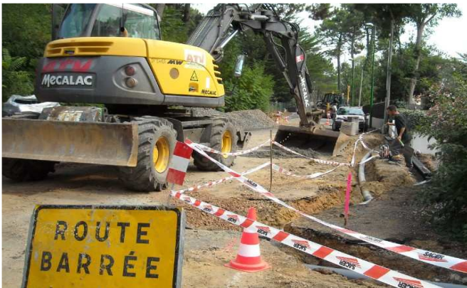
La rue des Goffineaux fait peau neuve

L'assainissement des rues privées va être réalisé dans les impasses des Cigales, de la République, du Général De Gaulle et de La Tourelle.