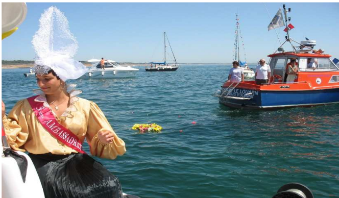
15 août: L'immersion de la gerbe, un moment émouvant

Le public, toutes générations confondues, a également été séduit et captivé par la qualité et la précision des textes accompagnant des différentes pièces exposées.