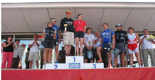
Un podium de haut niveau pour le 23e triathlon