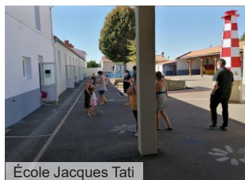
École Jacques Tati

Cette année, c'est le thème de l'environnement qui a été choisi comme projet éducatif à l'école Jacques Tati. Divers projets autour de ce thème vont être réalisés ( en fonction de l'évolution de la crise sanitaire ), comme par exemple, la mise en place d'un poulailler à l'école pour réduire les déchets et la participation à une action pédagogique sur le traitement de l'eau, en partenariat avec Vendée Eau 85.