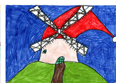
Timothe N. - 5 ans