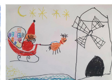
Calie T. - 5 ans