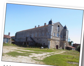
L'Abbaye du Lieu Dieu