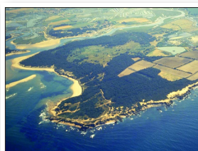
La Pointe du Payré