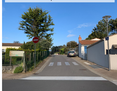
Mise en sens unique de la rue Pierre Curie

Ce local est donc prêt à accueillir l'équipe des maîtres-nageurs sauveteurs de la SNSM pour les prochaines saisons.