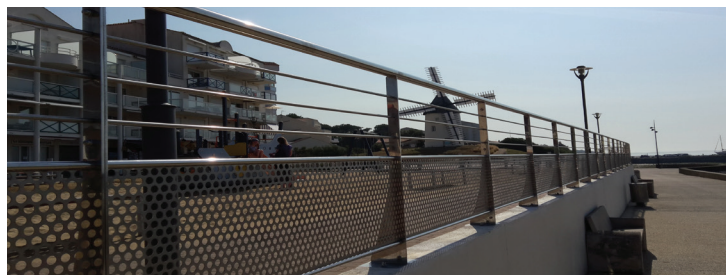
Esplanade Serge Caillaud

L'histoire commence en 2013 quand le garde-corps est installé pour la première fois sur l'esplanade Serge Caillaud. Mais au bout de 2 ans voilà qu'il se dégrade et manque de se désolidariser complètement du sol. C'est alors un combat qui commence avec les assurances pour faire reconnaître les malfaçons de conception et d'installation.