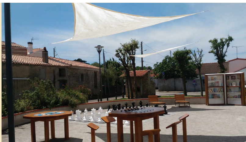
Nouvel aménagement de l'Espace Culturel