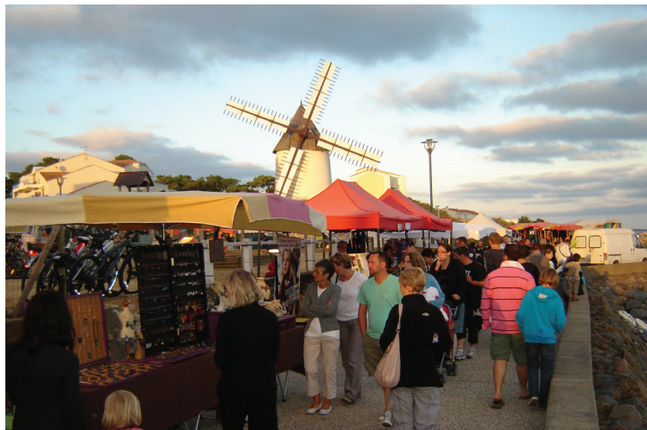
Nocturnes du port : les jeudis de 20h à 23h

Amateurs de produits artisanaux, locaux et même gourmands, venez flâner entre les stands des commerçants de 8h à 13h lors du marché hebdomadaire du lundi sur la place des Ormeaux et les mercredis gourmands de la rue piétonne. Retrouvez en soirée les nocturnes du port les jeudis de juillet et août de 20h à 23h avec plus de 80 exposants.