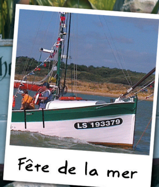
Fête de la mer