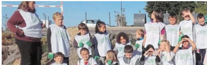
Dès le 22 septembre les enfants ont participé à une opération de nettoyage de la nature, en partenariat avec Trivalis

Quelques changements cette année : Animés par l'association « Les 4 saisons » les Temps d'Activités Périscolaires se dérouleront les mardis et jeudis après-midi.