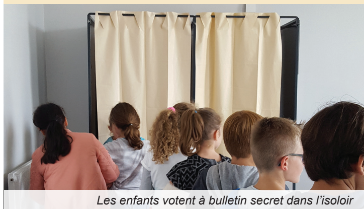
Les enfants votent à bulletin secret dans l'isoloir

Ce premier Conseil Municipal des Enfants sera bien évidemment épaulé par les conseillers municipaux dans l'accompagnement de leurs projets et de leur faisabilité. A contrario, les jeunes élus pourront être sollicités sur certains projets municipaux pour avoir leur avis avec leur regard d'enfants.