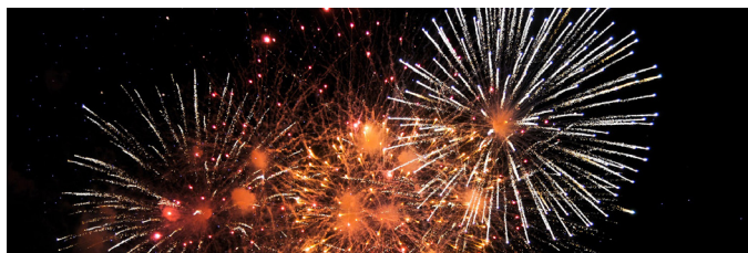
Spectacle pyrotechnique à 22h30, suivi d'un bal populaire.

Ce 15 août ne se terminera pas sans un feu d'artifice, conçu par « Jacques Couturier Organisation », sur le thème « De la Terre aux Étoiles » qui se décrit comme un voyage poétique haut en couleurs à travers l'histoire de l'univers.