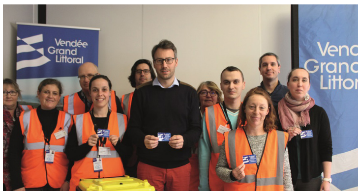
Les ambassadeurs du tri avec le Pass Vendée Grand Littoral

A Jard sur Mer, leur passage est programmé jusqu'à fin septembre. Ce sera aussi l'occasion de récupérer votre Pass Vendée Grand Littoral, la nouvelle carte d'accès aux cinq déchetteries du territoire. Merci de leur réserver un bon accueil.