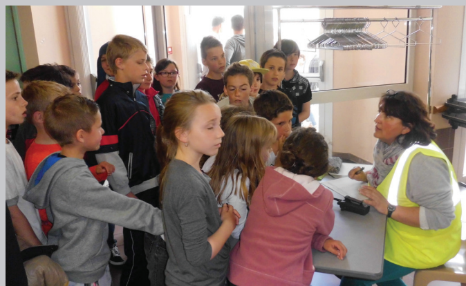
Les enfants évacués à la salle des Ormeaux sont comptabilisés auprès de l'équipe «Accueil-Population»

La simulation impliquait un camion de 20.000 litres de gaz renversé sur le rond point de l'église : l'installation de déviations, l'évacuation de l'école publique Jacques Tati ont donc été réalisées ainsi que la mise en place d'une équipe pour une éventuelle évacuation de la population. Quant aux 62 élèves présents, ils ont été redirigés vers la salle des Ormeaux, dans laquelle ils ont pu être comptabilisés où un goûter leur a été offert.