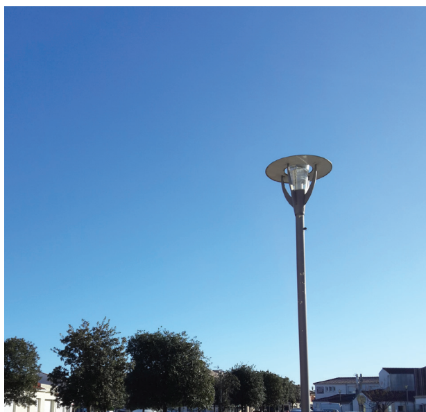
Consommation totale annuelle d'éclairage public (en kWh)

L'éclairage public est exploité par le SyDEV, le service public des énergies vendéennes, en collaboration avec la municipalité. Depuis 10 ans, de nombreux progrès ont été réalisés et ont une réelle incidence sur la consommation générée par l'ensemble des points lumineux.