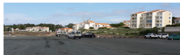
PARKING DE MORPOIGNE