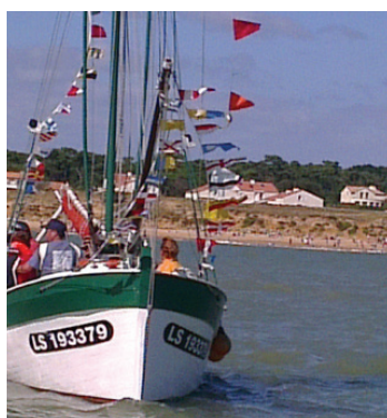
Fête de la Mer