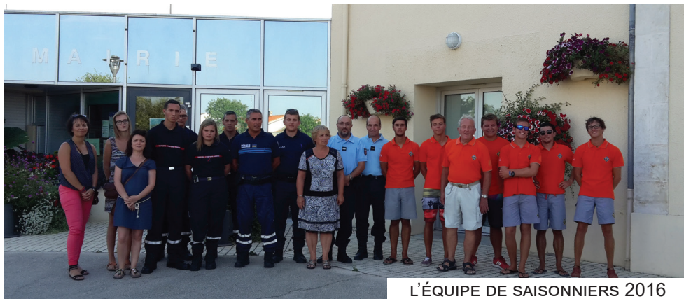
L'ÉQUIPE DE SAISONNIERS 2016