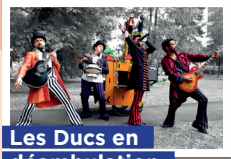
Les Ducs en déambulation