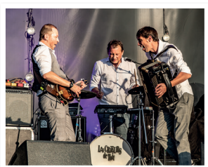
Les Crieurs de Toit