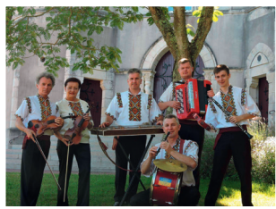
Constellation des Carpates