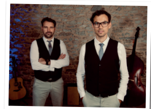
Cosy Duo Acoustique

9h-13h Mercredi gourmand > Centre-ville 14h30 Visite guidée des marais de Lieu-Dieu > Chemin de l'Abbaye de Lieu-Dieu (inscription obligatoire au 02 51 33 40 47) 21h00 Jeu musical "FA, SI, LA" > Port de plaisance