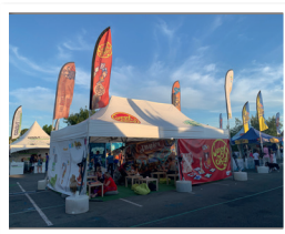
Village des jeux