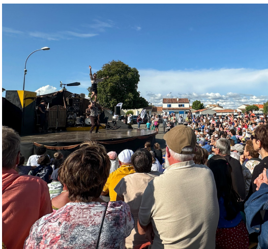
Réseau « La Déferlante » Spectacle « Mort ou vif » - Compagnie Silembloc

Après une saison 2025 réussie et ensoleillée, l'équipe prépare déjà l'été prochain pour offrir à tous, vacanciers mais aussi habitants de Jard sur Mer, des spectacles et concerts toujours plus variés et de qualité.