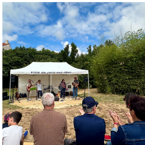
Concert du groupe « Drin Teurtou » à l'esplanade de verdure du parking des Ormeaux